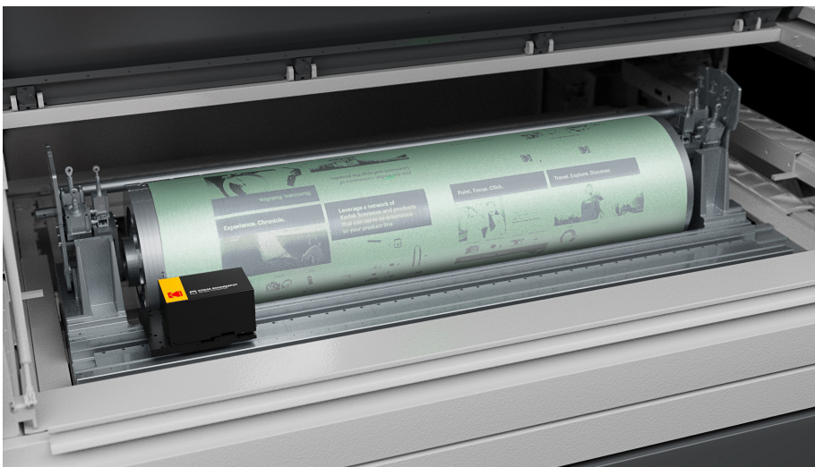
KODAK SQUARESPOT기술의 특징인 최신 써멀 헤드와 퓨전 드라이브로 KODAK SONORA 울트라 무현상 판재를 이미징

4-up, 8-up, VLF 포맷에 상관없이, 포장이나 매엽식, 히트세트 웹 프레스에 상관없이, 코닥의 이 최신 장치는 업계에서 가장 다목적성이 뛰어난 VLF CTP입니다. 항상된 자동화는 판재의 생산성, 효율성, 고품질을 한층 높여주면서, 폐기물, 비용, 설치면적, 수동 개입을 최소한으로 유지시켜 줍니다.