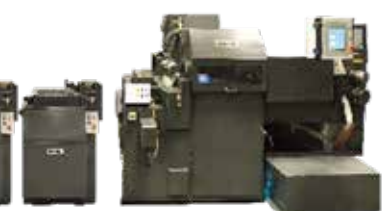
Se muestran accesorios opcionales