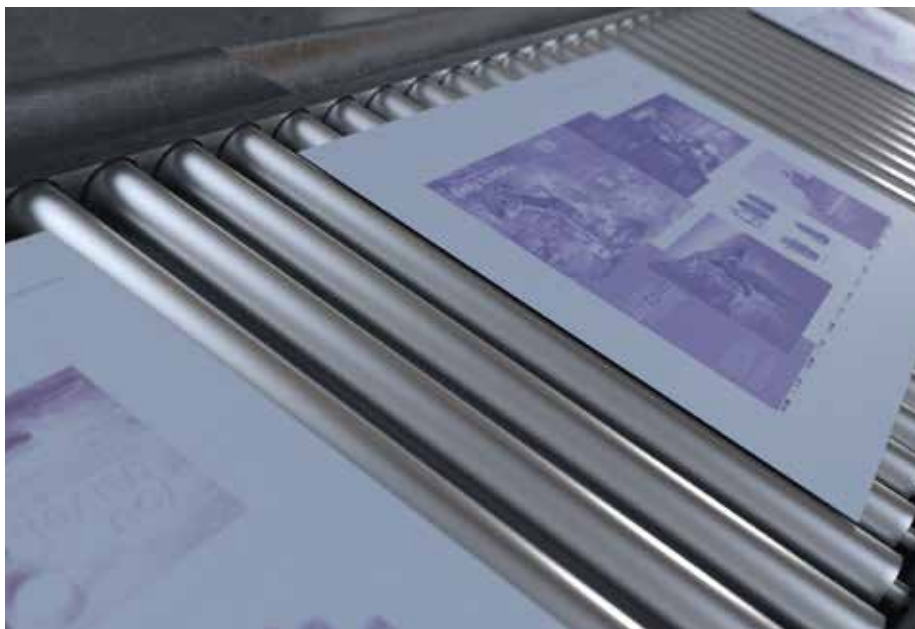
全胜Q400/Q800直接制版机与腾格里免冲洗印版全面兼容

全新、选配的柯达Mobile CTP控制应用程序可让用户透过安卓或IOS设备监控其全胜T400/T800直接制版机。即使用户不在现场，都可以第一时间掌握CTP设备的情况，快速高效地重启制版。